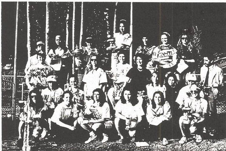
Foto ricordo. Sulla pista dello Scag erano presenti quattordici azzurre, sei statunitensi, due neo zelandesi ed una australiana.